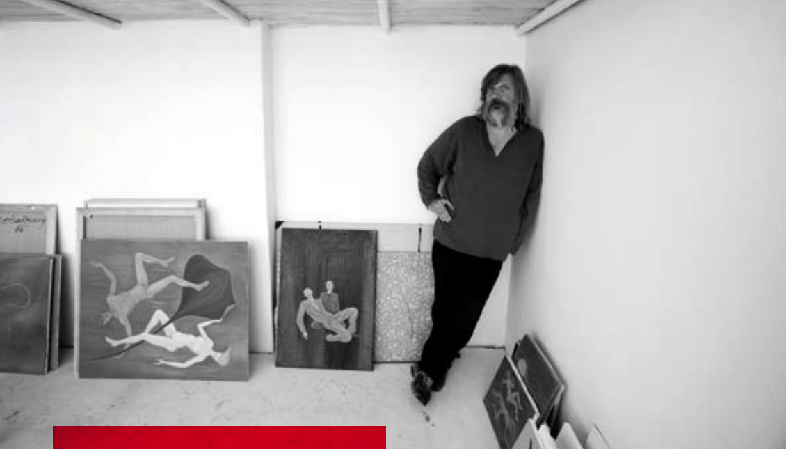
TOMÁŠ CÍSAŘOVSKÝ *1962

Vystudoval pražskou Akademii výtvarných umění. Své obrazy vystavoval například ve Veletržním paláci, v Rudolfinu a také na řadě míst v zahraničí. Patří mezi nejznámější a nejuznávanější současné figurální malíře, i když v posledních letech se věnuje i krajině. Mezi jeho nejznámější díla patří pozoruhodný cyklus portrétů českých šlechticů nazvaný Bez koní. Je ženatý a má dvě děti.