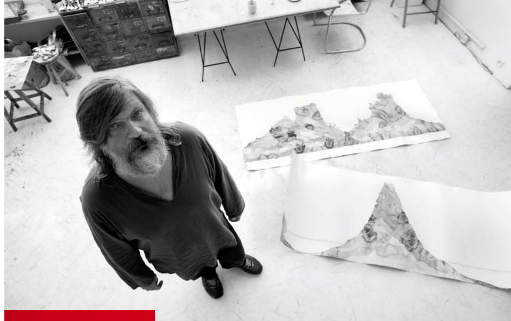
ve svém pražském ateliéru