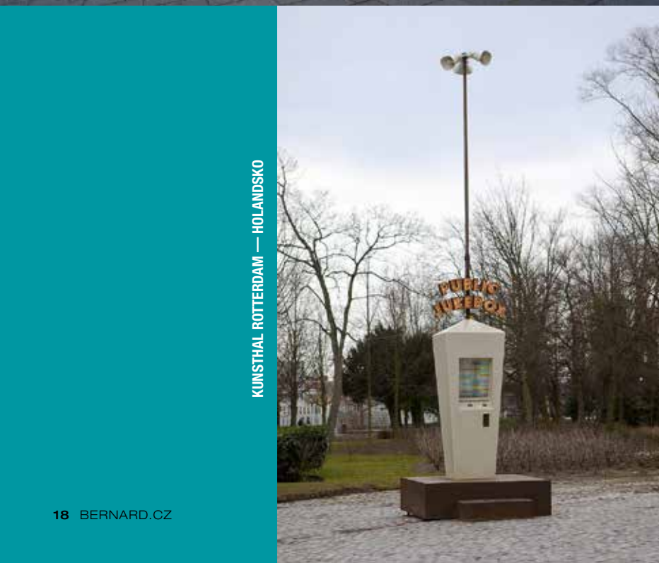
KUNSTHAL ROTTERDAM — HOLANDSKO