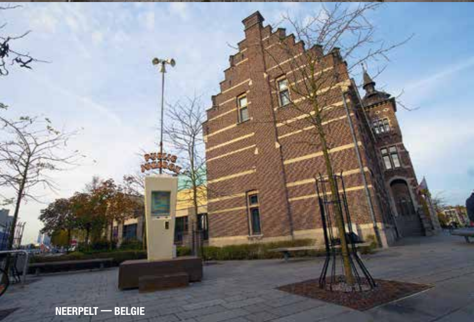
NEERPELT — BELGIE