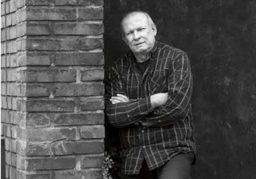
JOSEF PLESKOT *1952

Vystudoval architekturu na ČVUT v Praze. Nejdřív se zabýval teorií na fakultě architektury, pak pracoval v Krajském projektovém ústavu v Praze a po roce 1989 založil vlastní ateliér. Je ženatý, má dvě děti a žije v Praze.