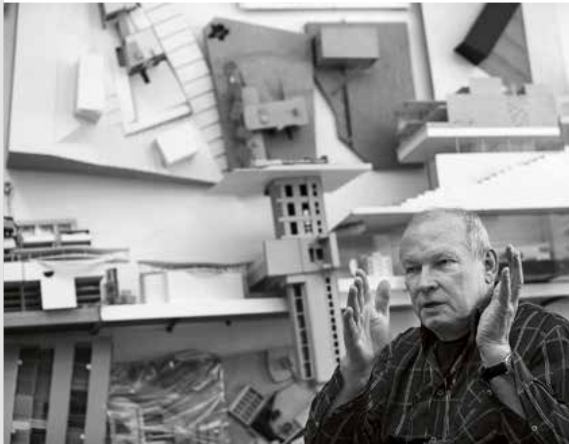
Ve svém ateliéru v Praze Holešovicích