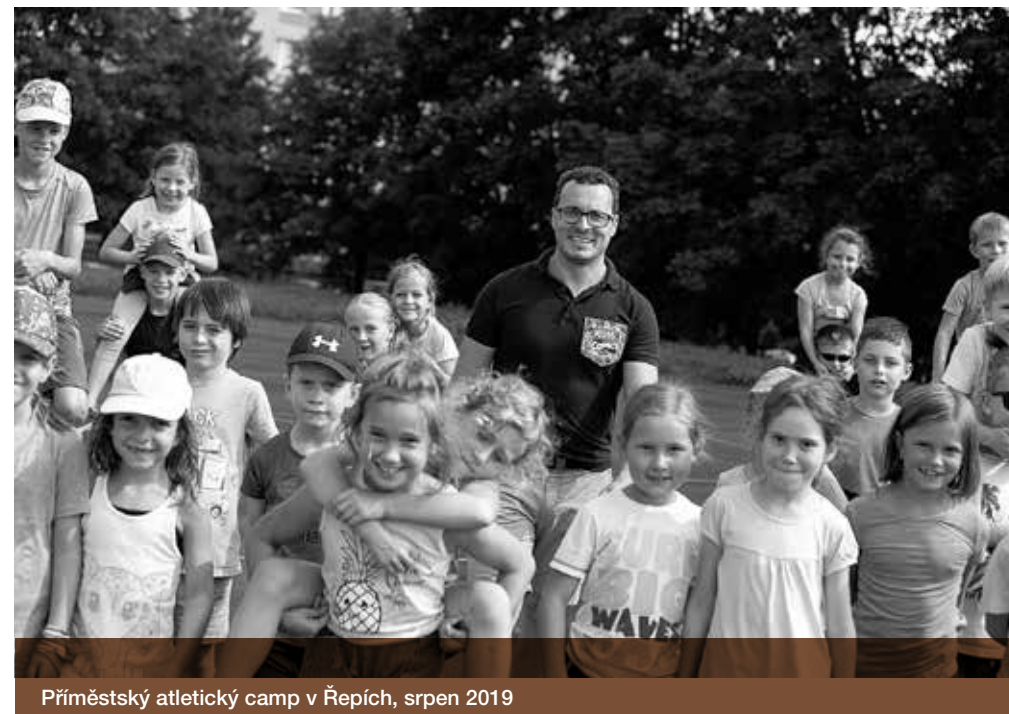
Příměstský atletický camp v Řepích, srpen 2019

Zařekl jsem se, že se nikdy nebudu ženit, a až do letoška mi to vydrželo. Kdo se mnou chce být, musí se takřka bezvýhradně přizpůsobit mně a mému tempu. Pro mě je největší strašák, že bych se musel rozvést, že